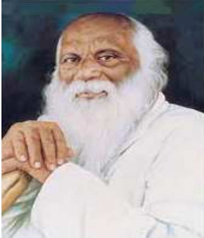
Padmabhushan Dr. Karmaveer Bhaurao Patil Founder of Rayat Shikshan Sanstha, Satara