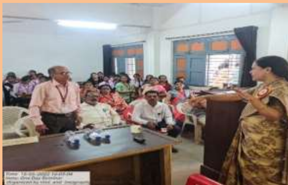
Discussion of a Session