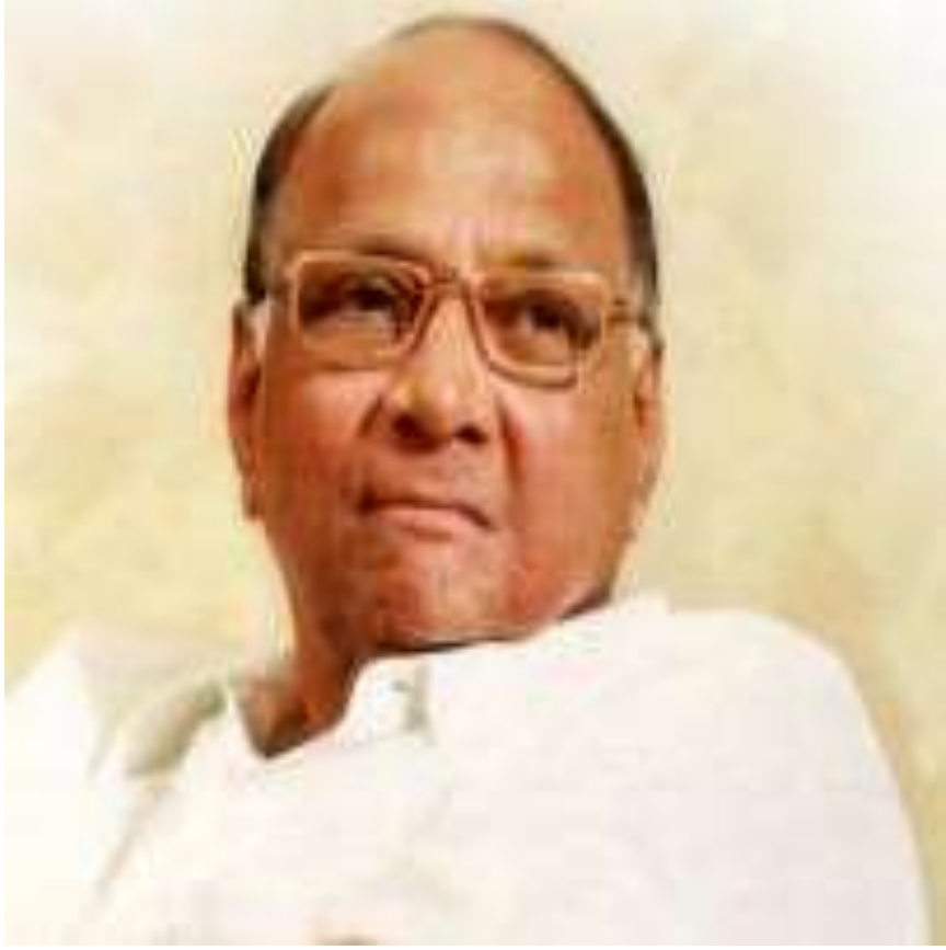
Our Patrons Hon. Shri. Sharadchandraji Pawar Saheb President, Rayat Shikshan Sanstha, Satara