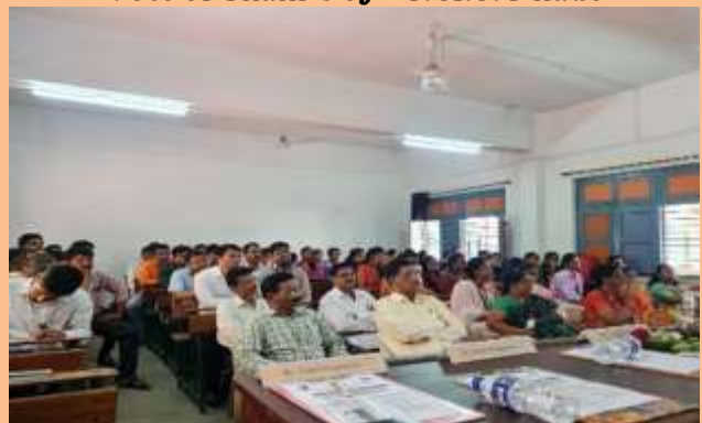
Participants of the National Seminar